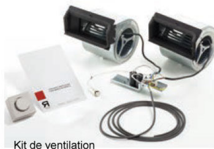
Kit de ventilation

Le très grand insert pour angle G 505, un bijoux de conception qui par son design, son large foyer sa vue extraordinaire du feu et des flammes ainsi que ses excellentes performances de chaleur en font l'appareil de chauffage au bois le plus performant du marché actuel. En effet avec un rendement de 80%, une puissance de 15 Kw et une faible consommation en bois de 4Kg/h il est le champion dans sa catégorie d'autant qu'il peut s'installer facilement dans un conduit de fumée placé dans un petit angle. Les larges dimensions du foyer avec sa vitre escamotable permettent d'introduire de très grandes bûches de bois afin de bénéficier d'une haute autonomie de combustible. Enfin, avec ses sorties d'air chaud, il peut au moyen d'un kit de ventilation propulser la chaleur dans toutes les pièces de la maison et même chauffer votre garage et ceci à un prix défiant toute concurrence.